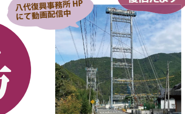
八代復興事務所HPにて動画配信中

令和2年7月豪雨で流出した球磨川橋梁10橋の内、すべての橋梁の下部工はほぼ完了しました。坂本橋はP1-A2を一括架設で完了し、トラベラクレーン工法によりA1-P1を架設中。大瀬橋・沖鶴橋は送出し工法による架設状況を動画で見ることができます。鎌瀬橋は11月24日よりケーブルエレクション斜吊工法により上部工架設がスタートします。N/S