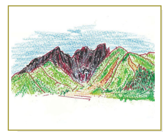
四季見茶屋からみた根子岳 荒々しい根子岳の岩肌が印象的でした。H/N