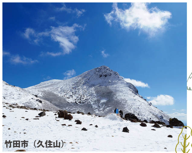
寒波到来!初めての冬山訓練

島原市へ行った際、島原城築城400年と書かれたポスターを見ました。島原城は松倉豊後守重政公が元和4年(1618年)から7年の歳月を費やして築いたお城で、江戸時代初期の完成段階の石垣構築技術など桃山期の築城観を併せ持つ壮麗な城郭です。ちなみに熊本城は平成19年(2007年)に築城400年を迎えたので、島原城より18才年上のお城という事になります。I/O