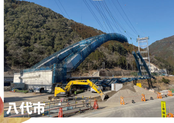
今回は、鎌瀬橋の架設状況についてレポートします。橋長200mのバスケットハンドル型ニールセンローゼ橋という美しい姿の橋です。昨年11/24よりケーブルエレクション斜吊工法により上部工架設がスタートしました。あと2~3ブロックで上弦材のアーチがドッキングするところまで来ていました。N/S